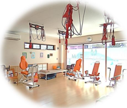
デイサービスのマシンで運動ニーズに対応できたら…