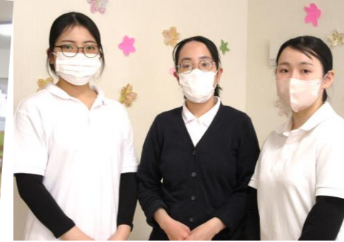
淑徳大学看護学科の皆さんは調理に挑戦してくださいました!!