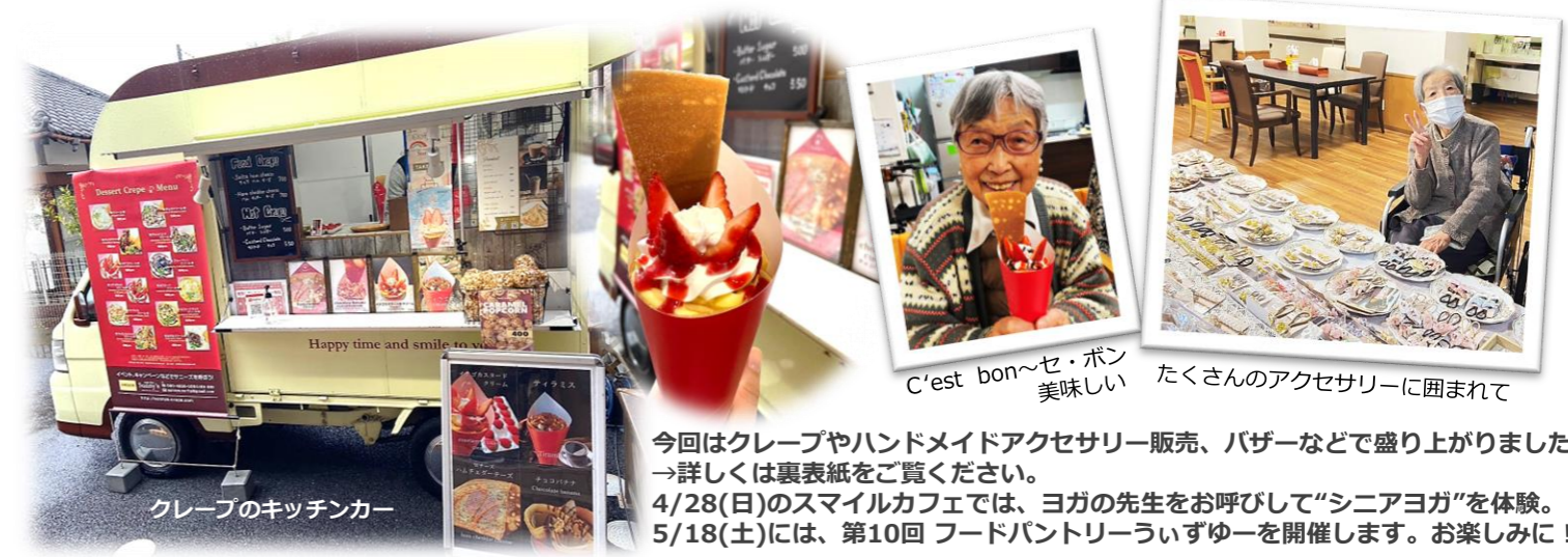
クレープのキッチンカー