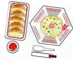
エビチャーハンと餃子