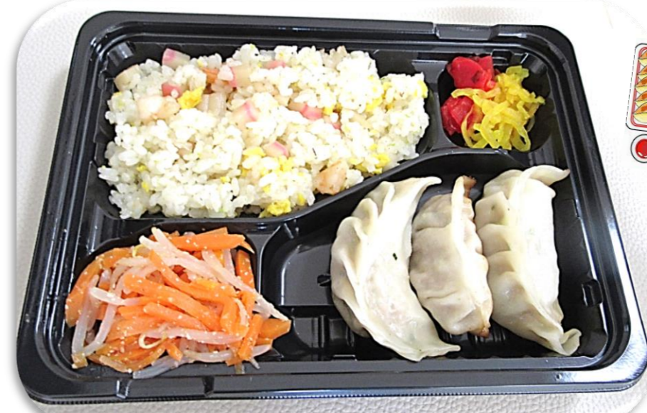
フードロスを美味しく、今回は“中華弁当”です!!