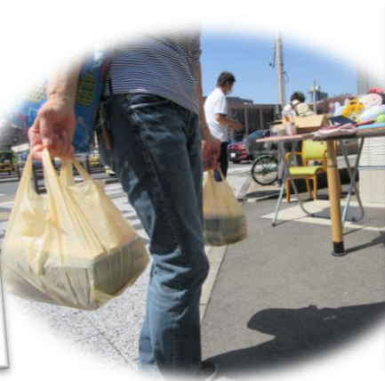
あっという間にもう無い!? 人気No.1のお弁当