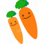
人参ともやしのナムル