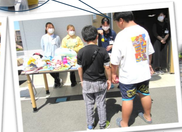
お友だちを連れて再び登場する小学生!!