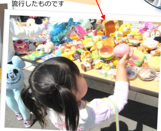
あれもこれも欲しくなっちゃうけど…我慢