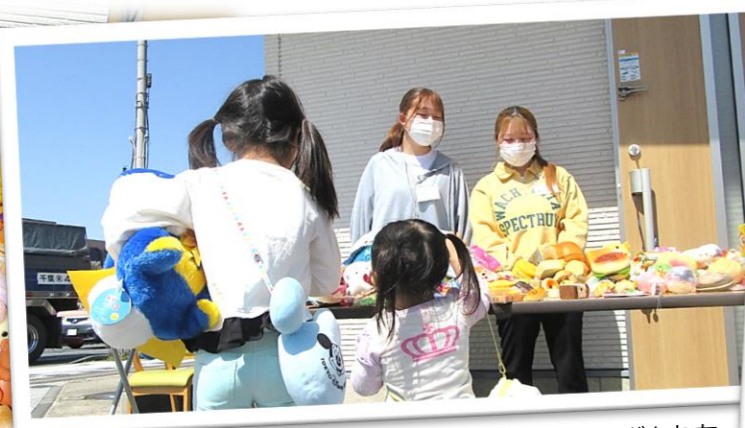
「一つだけよ」とお母さんの言いつけを健気を守る子どもたち