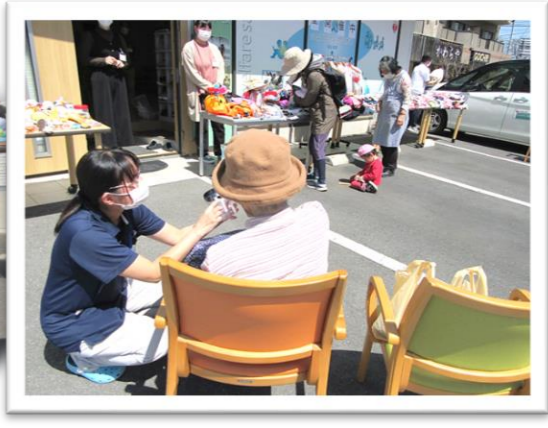
募金をしてくださいました♡