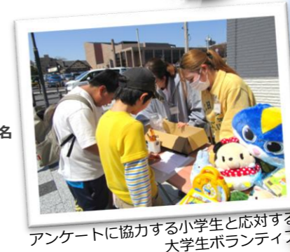
アンケートに協力する小学生と対応する大学生ボランティア