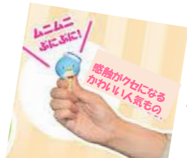
スイーツは2014年頃から女子中学生中心に流行したものです