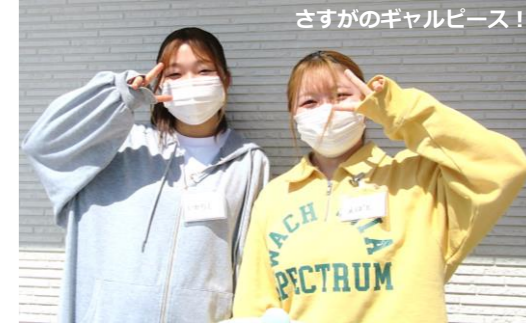
さすがのギャルピース!