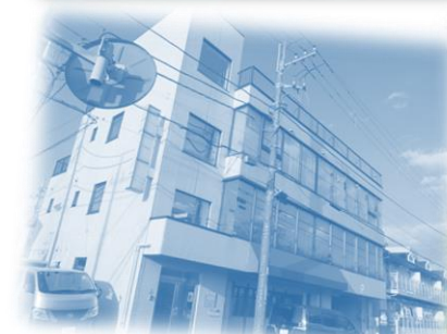
勝田台北の放課後等デイサービス(1F)