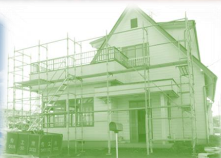
八街のデイサービス

2025年は ①放課後デイサービスの開設 ②八街地域でのデイサービスないしは宿泊施設の開設 ③成田での有料老人ホームの開設 ④八千代緑が丘での複合施設の開設(今年、建設も含む大掛かりなものとなる) 以上の新規開設が行われます