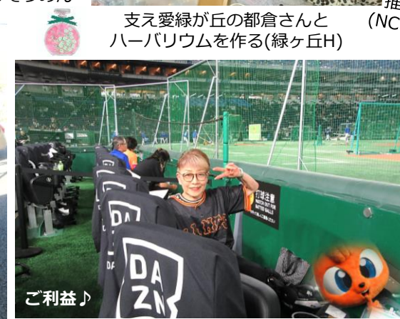
少年野球連盟の会長から長年のボランティアの ご褒美にDAZN EXCITE SEAT(東京ドーム)を戴く