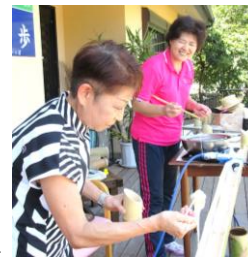
一歩で流しそうめん