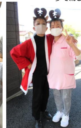
千葉北のクリスマス会で