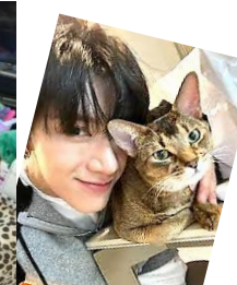
推しのTEN (NCT, WayV)